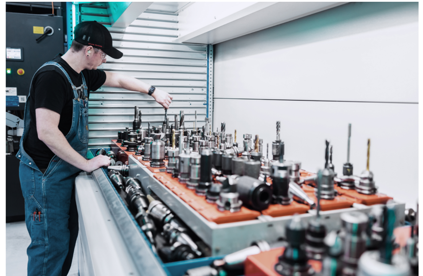
Werkzeuglagerung mit dem Kardex Shuttle

Weitere Optionen und Lagerumgebungen mit Klimatisierung, Reinraumbedingungen, Brandschutz oder ESD-Ausführung sind ebenfalls verfügbar.