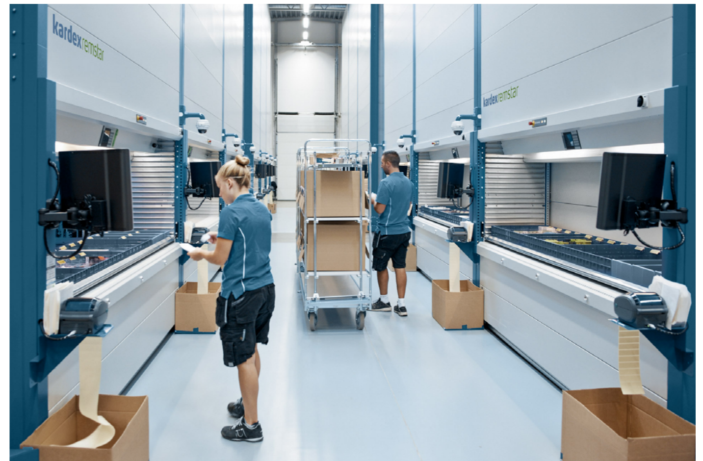
Kommissionierung mit dem Kardex Shuttle